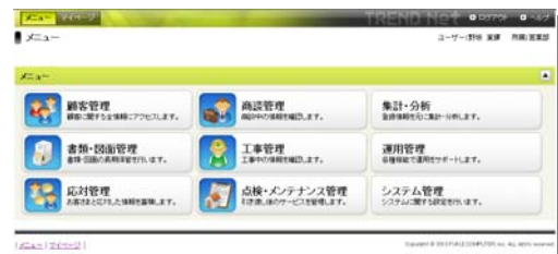
■TOP ページ：目的に合わせてメニューを選択

今回発売する「TREND Net 2011」では、顧客情報を社内で共有しながら利活用する事で、問い合わせを頂いた際なども即座に対応が可能となり、顧客満足度を高めながら、受注創出を支援するサービスとなっています。